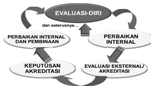
Bagan 1. Daur Penjaminan Mutu dalam Rangka Akreditasi

Seperti dikemukakan terdahulu, evaluasi-diri merupakan salah satu aspek penting dalam keseluruhan daur akreditasi dengan berbagai peran dan kegunaannya, termasuk penjaminan mutu ( quality assurance ). Keseluruhan daur penjaminan mutu dalam rangka akreditasi program studi/ perguruan tinggi itu dilukiskan dalam Bagan 1.